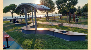
PV Panel Entegreli Kent Mobilyası ürettik.