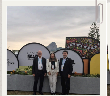
Brezilya-C40 Dünya Belediye Başkanları Zirvesi

Belediyemizin tüm birimlerinden belirlenmiş olan iklim sorumlularımıza yönelik “Bilgilendirme Toplantısı” gerçekleştirdik.