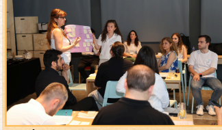
İstanbul Çalıştayı düzenledik.

Pilot bölge olarak belirlenen Kadıköy bölgesindeki binaların güneş enerjisi potansiyeli hesaplandı. Üretilen temiz enerjinin depolanmadan bina, aydınlatma için kullanılmasının ve kalan enerjinin şehir içi ulaşımdaki hafif elektrikli araçlara aktarılmasının dijital ikiz teknolojisi ile modellenmesi yapıldı.