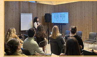
Barselona'da Final Konferansına katıldık.